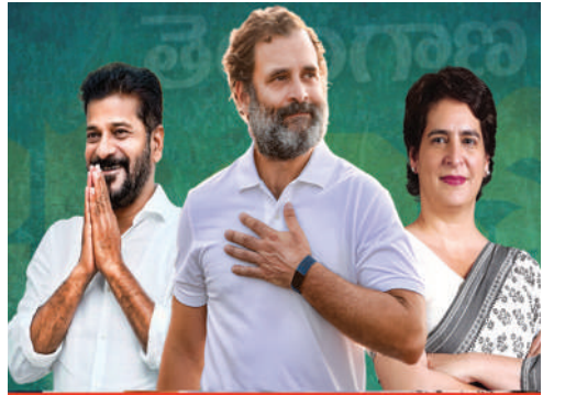
తెలంగాణ ప్రదేశ్ కాంగ్రెస్ కమిటీ