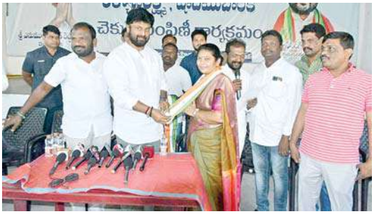
ఎమ్మెల్యే రాజీరాగూర్ ఆధ్వర్యంలో..