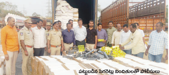
పట్టుబడిన సిగరెట్లు నిందితులతో పోలీసులు