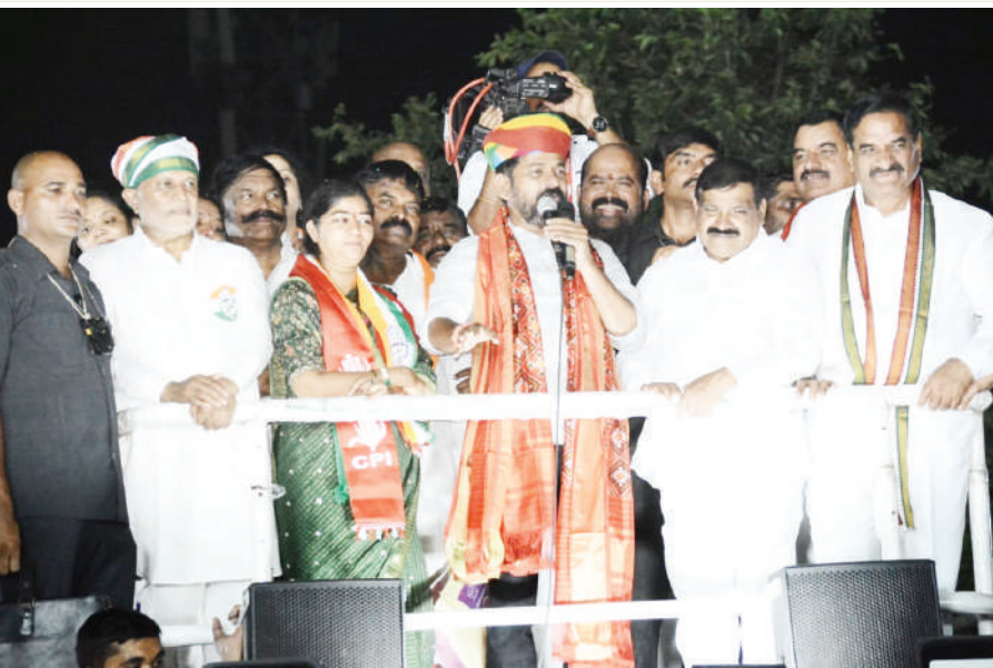
ఎల్వీనగర్, ఏప్రిల్ 28 (జనం సాక్షి) :

చేసిందని ఓట్లు వేయాలని ప్రశ్నించారు. కేంద్రంలోని మోడీ ప్రభుత్వం పదేళ్ల పాలనలో బయ్యారం ఉక్కు ఫ్యాక్టరీ ఇవ్వలేదని, ఐటిఐ ఆర్ కారిడార్ను చేశారని, పాలమూరు ఎత్తిపోతల పథకానికి జాతీయ హోదా ఇవ్వలేదని, కాజీపేట కోచ్ ఫ్యాక్టరీ ఇవ్వలేదని రేవంత్ రెడ్డి విమర్శించారు. ఈ సందర్భంగా మధుయాపి గౌడ్ మాట్లాడుతూ.. కాంగ్రెస్ పార్టీ అధికారంలో వచ్చిన 100 రోజుల లోనే మెట్రోను హయత్ నగర్ పొడిగించడం, ఎయిర్పోర్ట్ వరకు తీసుకొని వెళ్లేలా సీఎం రేవంత్ రెడ్డి ప్రకటించడం గొప్ప విషయం అన్నారు. తెలంగాణలో సీఎం రేవంత్ రెడ్డి సర్కారు అమలు చేస్తున్న అరు గ్యారంటీలు ఈరోజు దేశానికి ఆదర్శమయ్యాయని, కాంగ్రెస్ పార్టీ జాతీయ మేనిఫెస్టో కూడా తెలంగాణ మోడల్ ని తీసుకున్నదని పేర్కొన్నారు కాంగ్రెస్ ప్రకటించిన ఐదు న్యాయ గ్యారంటీ పథకాలు దేశ ప్రజలను ఆకట్టుకున్నాయని, కేంద్రంలో కాంగ్రెస్