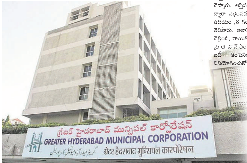
గ్రేటర్ హైదరాబాద్ మున్సిపల్ కార్పొరేషన్ GREATER HYDERABAD MUNICIPAL CORPORATION గ్రేటర్ హైదరాబాద్ మున్సిపల్ కార్పొరేషన్