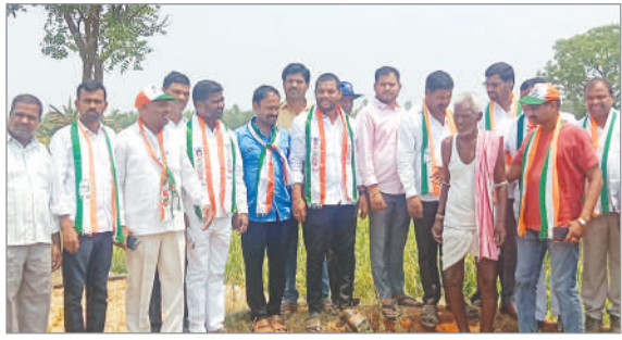
మతి భ్రమించి మాట్లాడుతున్న బిఆర్ఎస్ నాయకులు శామీర్ పేట్ ఏప్రిల్ 29 (జనం సాక్షి)