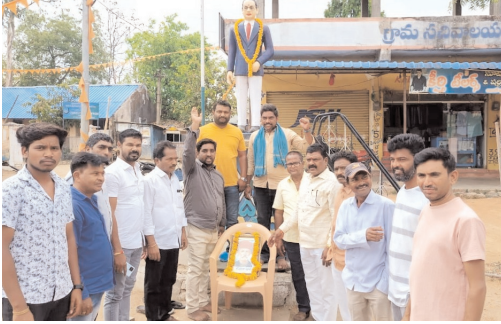
బహుజనుల విద్య, ఉద్యోగం రిజర్వేషన్ల కోసం, అంటరానితనం నిర్మూలన కోసం పోరాడిన యోధుడు పూలే నేటి యువత వీరి జీవితాన్ని