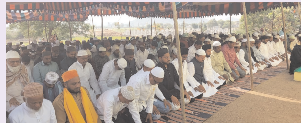
ఆలింగనం చేసుకొని ఒకరికొకరు సోదర భావాన్ని వ్యక్తం చేసుకున్నారు. ఈ కార్యక్రమంలో ముస్లిం సోదరులు మత గురువులు ఆయా గ్రామాల్లోని ప్రజాప్రతినిధులు, మాజీ గ్రామస్తులు తదితరులు పాల్గొన్నారు.

శంకరపట్నం, ఏప్రిల్ 11 (జనంసాక్షి): రంజాన్ పర్వదినాన్ని పురస్కరించుకొని గురువారం శంకరపట్నం మండలంలో ముస్లిం సోదరులు ఘనంగా రంజాన్ వేడుకలను అత్యంత భక్తిశ్రద్ధలతో నిర్వహించుకున్నారు. మండలములోని కేశవపట్నం, మొలంగూర్, కరీంపేట్, ఎరడపల్లి, తాడికల్ గ్రామాలతో పాటు పలు గ్రామాల్లో రంజాన్ పండగ పురస్కరించుకొని, ప్రత్యేకంగా ఏర్పాటు చేసిన ప్రార్థన మందిరాల్లో ఉదయం ముస్లిం సోదరులు చేరుకొని మత గురువుల ఆధ్వర్యంలో ప్రత్యేక ప్రార్థనలు నిర్వహించారు. ముస్లిం సోదరులకు హిందూ సోదరులు రంజాన్ శుభాకాంక్షలు తెలుపు