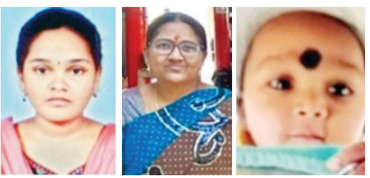
అత్తహత్యకు పాల్పడ్డ తల్లి,కూతురు, మృతి చెందిన కుమారుడు

కొడుకుకు పురుగుల మందు తాగించి తల్లి అత్తహత్య కూతురి, మనవడి మరణాలు తట్టుకోలేక మృతురాలి తల్లి కూడా అత్తహత్య