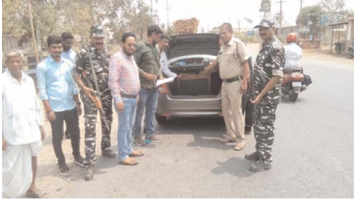
అక్రమ మద్యం, నగదు రవాణా చేస్తే చర్యలు.