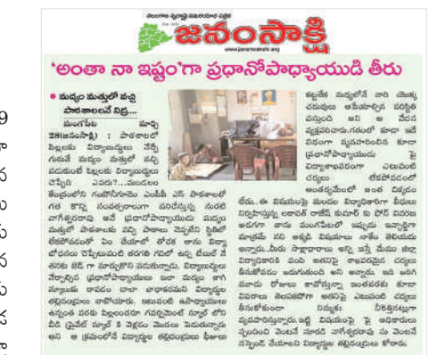
జిల్లా విద్యాశాఖాధికారి ఉత్తర్వులను జారీ చేశారు.