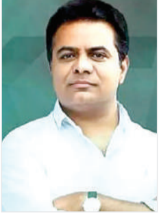
హైదరాబాద్, మార్చి 19 (జనంసాక్షి) : అమెరికాలోని నార్త్ వెస్టర్న్ యూనివర్సిటీ ఆధ్వర్యంలో నిర్వహిస్తున్న ఇండియా బిజినెస్ కాన్ఫరెన్స్ కు హాజరు కావాలని రాష్ట్ర మాజీ మంత్రి కేటిఆర్ కు ఆహ్వానం అందింది. ఇల్లియాయ్ రాష్ట్రంలో ఏప్రిల్ 13న జరగబోతున్న ఈ సదస్సులో భారత పారిశ్రామిక రంగంలో నెలకొన్న అవకాశాలు, సవాళ్లపై అనేకంపై జరిగే చర్చల్లో పాల్గొని ప్రసంగించాలని ఆహ్వానించారు. రాష్ట్ర ప్రభుత్వంలో బిటి, పారిశ్రామిక శాఖ మంత్రిగా పనిచేసిన సందర్భంగా పారిశ్రామిక రంగాన్ని పరుగులు పెట్టించడానికి, పెట్టుబడులను ఆకర్షించడానికి రూపకల్పన చేసిన పాలనలు, అవి

భారత పారిశ్రామిక రంగంలో ఉన్న అవకాశాలు, సవాళ్లపై ప్రసంగించాలని విజ్ఞప్తి