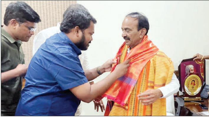
మేడ్చల్ జిల్లా ప్రతినిధి, మార్చి 20 (జనంసాక్షి) :

ఘనంగా మాజీమంత్రి, బీజేపీ మల్కాజిగిరి ఎంపీ అభ్యర్థి పుట్టినరోజు వేడుకలు