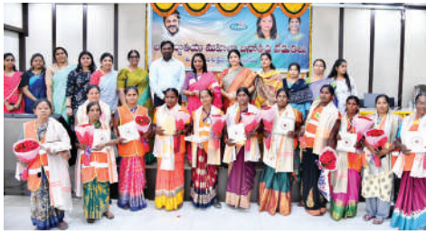
జెహెచ్ఎంసి ప్రధాన కార్యాలయంలో ఘనంగా అంతర్జాతీయ మహిళా దినోత్సవ వేడుకలు