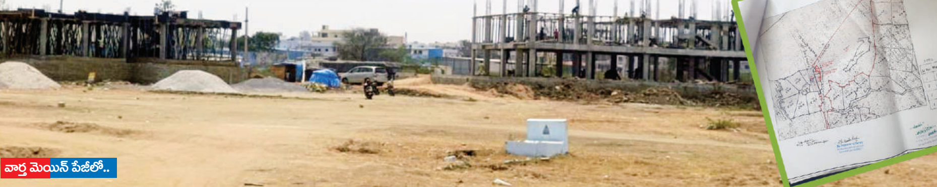
వార్డు మెయిన్ పేజీలో..