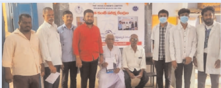
ఐసిఎల్ ఆధ్వర్యంలో కంటి పరీక్షలు నిర్వహించడం అభినందనీయం