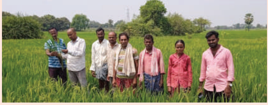
చెన్నూర్, మార్చి, 15 (జనం సాక్షి) మండలంలోని ఆస్సాద్ క్షేత్ర