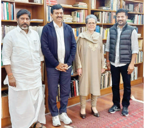
ధీల్లో సోనియా గాంధీని కలిసిన ముఖ్యమంత్రి రేవంత్ రెడ్డి, డిప్యూటీ సీఎం భట్టి విక్రమార్క, మంత్రి పాంగులెటి శ్రీనివాస్ రెడ్డి

హైదరాబాద్ (జనంసాక్షి): రానున్న లోక్ సభ ఎన్నికల్లో తెలంగాణ నుంచి హాటీ చేయాలని కాంగ్రెస్ పార్టీ మంత్రి పార్టీ చైర్మన్ సోనియా గాంధీకి ముఖ్యమంత్రి, సీపీఎం అధ్యక్షుడు రేవంత్ రెడ్డి విజ్ఞప్తి చేశారు. తెలంగాణ నుంచి హాటీ చేయాలని కోరుతూ ఇప్పటికే సీపీఎం తీర్మానించిన విషయాన్ని ఆయన సోనియా గాంధీ దృష్టికి తీసుకెళ్లారు. తెలంగాణ ఇచ్చిన తల్లిగా రాష్ట్ర ప్రజలు గుర్తిస్తున్నందున రాష్ట్రం నుంచి హాటీ చేయాలని కోరుతున్నట్లు చెప్పారు. స్వందించిన సోనియా గాంధీ సరైన సమయంలో నిర్ణయం తీసుకుంటానని తెలిపారు. ముఖ్యమంత్రి సోనియా గాంధీ అధికారిక వివాసం 10, జనపథ్ లో ఆమెను ముఖ్యమంత్రి రేవంత్ రెడ్డి సోమవారం సాయంత్రం కలిశారు. మగతా 2లో..