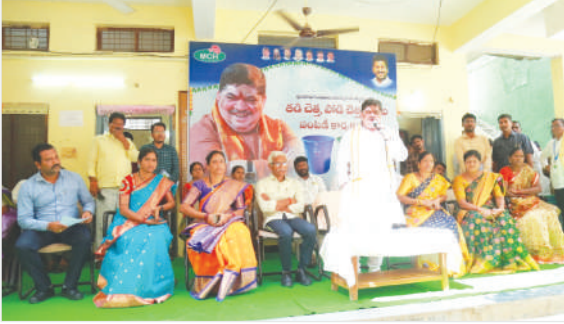
హుస్సాబాద్, ఫిబ్రవరి 26(జనం సాక్షి) సిద్దిపేట జిల్లా హుస్సాబాద్ మున్సిపల్ కార్యాలయంలో సోమవారం రాష్ట్ర రవాణా బీసీ సంక్షేమ శాఖ మంత్రి పాస్పం ప్రభాకర్ చేతుల

తెలిపారు. చేపట్టే మహిళలకు సంబంధించి 500 కే గ్యాస్ సిలిండర్, 200 యూనిట్ల ఉచిత విద్యుత్ ప్రారంభం కాదని,ఇల్లు లేని వారికి 5 లక్షల చొప్పున ముందుగా నియోజకవర్గానికి 3500 ఇళ్ల చొప్పున మొదటి దశలో ఈ ఆర్థిక సంవత్సరంలో అందిస్తున్నట్లు ప్రకటించారు. పూర్తిగా నిరాశ్రయులైన వారికి మాత్రమే మొదటి ఇల్లు అందించనున్నట్లు, మన ఊరు మన పరిశుభ్రంగా ఉంచుకుంటే అందరికీ ఆరోగ్యకరం అవుతుందని, జనవరి 30 గాంధీ వర్ధంతి సందర్భంగా పట్టణాన్ని పరిశుభ్రంగా ఉంచుతున్న సిబ్బందిని సన్మానించుకోవడం జరిగిందని గుర్తు చేశారు.