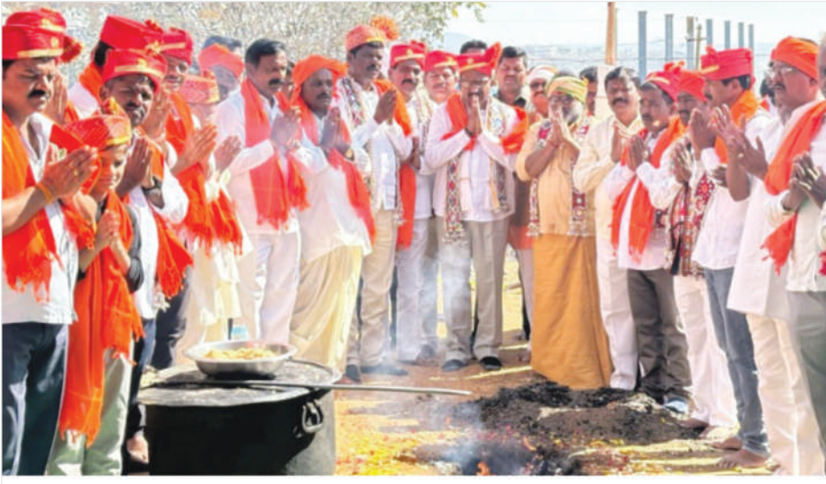
చర్చించమని ఆయన హామీ ఇచ్చారు. లంబాడీ తాండాల గ్రామ పంచాయతీలుగా